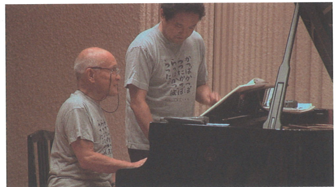
▲親子連弾。こんなシーンもありました。