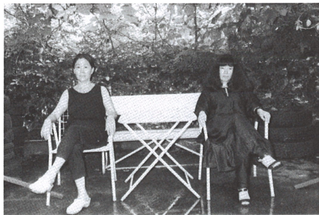
サンジュラ商会の2人

E. カニングハム記念 青少年音楽協会のMFYサロンでは、 定期的にコンサートを開いています。 お電話またはFAXにてお申し込み下さい。