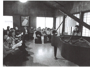
MFYサロンコンサートより